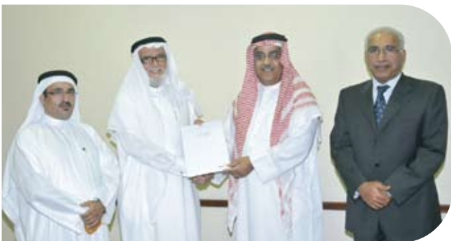
The Saudi Bahraini Institute for the Blind