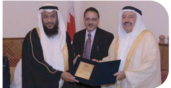
Al Baraka Society