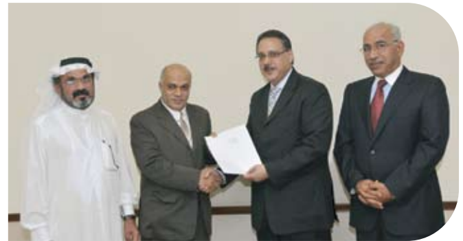
The Friendship Society for the Blind