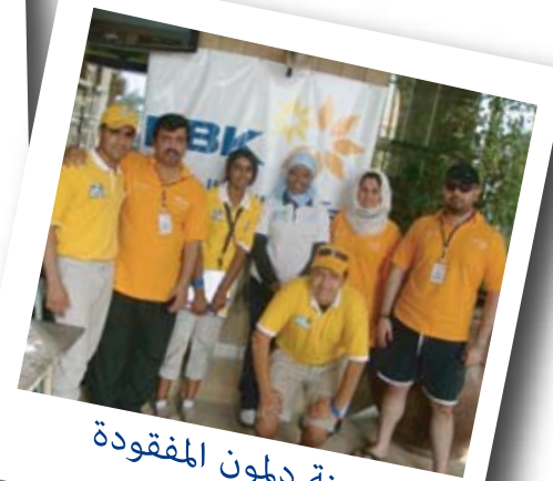
جنة دلمون المفقودة