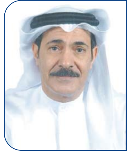
الشيخ راشد بن سلمان آل خليفة نائب للرئيس التنفيذي لمجموعة الأعمال

يمتلك الشيخ راشد آل خليفة خبرة تزيد عن ٢٥ عاماً في القطاع المصرفي على الصعيدين الإقليمي والدولي، وماجستير في إدارة الأعمال من جامعة ولاية أريزونا في الولايات المتحدة الأمريكية، فضلاً عن التدريب على الخدمات المصرفية الائتمانية في مصرف تشيس مانهاتن بمدينة نيويورك. وقد سبق له التدريب والعمل في مصارف إقليمية ودولية شاغلاً مناصب مهمة، أما بعد انضمامه لبنك البحرين والكويت فإن الشيخ راشد يخطط لاستخدام قدراته وخبراته المصرفية في تحقيق الأهداف التي يصبو إليها بنك