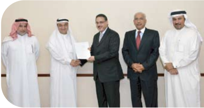
الجمعية البحرينية لمتلازمة داون