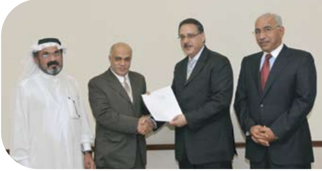
جمعية الصداقة للمكفوفين