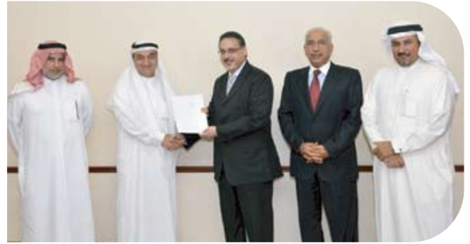
Bahrain Down Syndrom Society