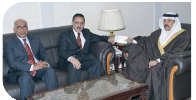
مركز البحرين للدراسات والبحوث