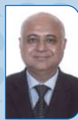
براديب تانيجا المعاملات المصرفية Pradeep Taneer Transactional Banking