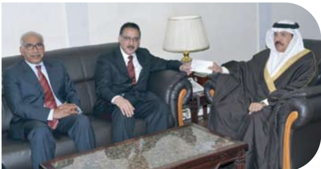
Bahrain Centre for Studies and Research