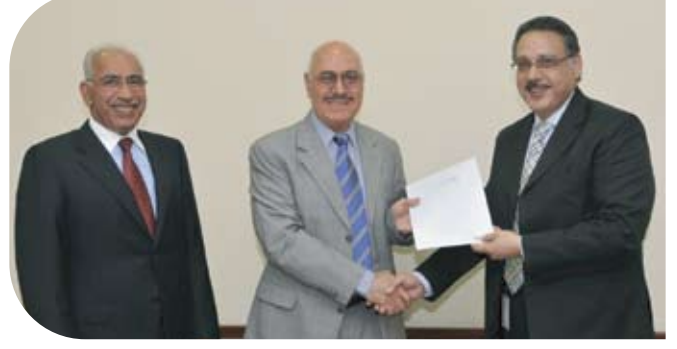
دار رعاية الطفولة