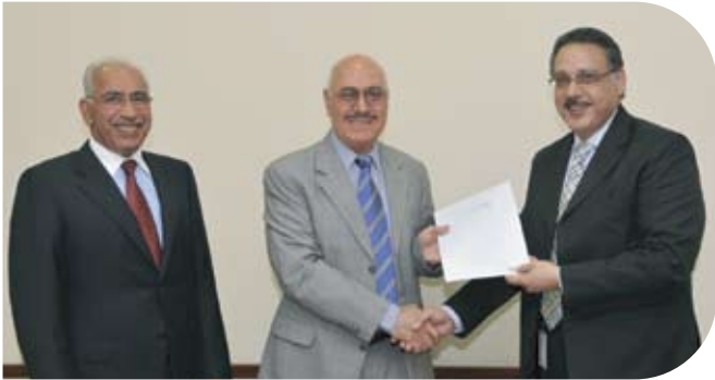
Child Care Home