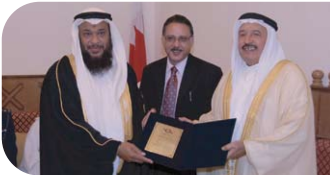
جمعية البركة الخيرية