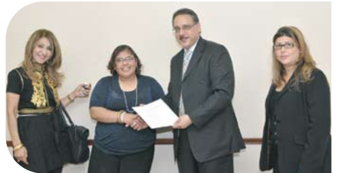
الجمعية البحرينية لأولياء أمور المعاقين وأصدقائهم