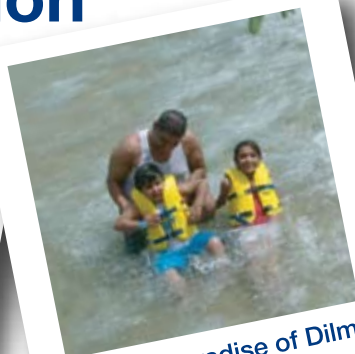
The Lost Paradise of Dilmun