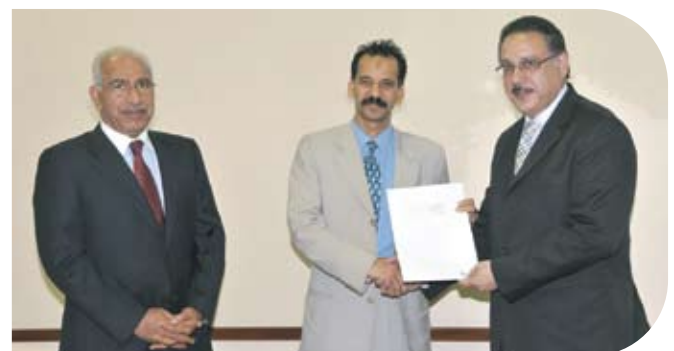
Al Kawther Society for Social Care