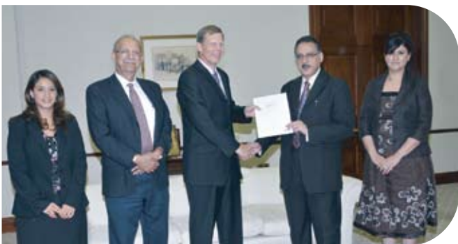
American Mission Hospital