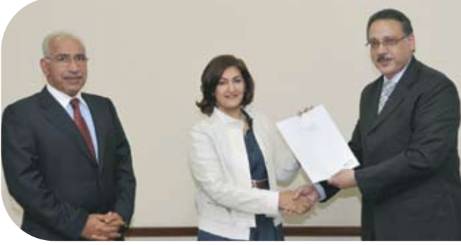
معهد الأمل للتربية الخاصة