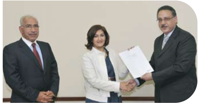
Hope Institute for Special Education