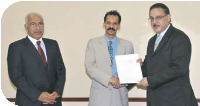
جمعية الكوثر للرعاية الاجتماعية